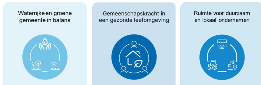
Figuur 2: De opbouw van de pijlers voor de toekomst Olst-Wijhe 2050